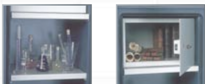
Acessórios interiores (da parte esquerda): Prateleira, compartimento com fecho.